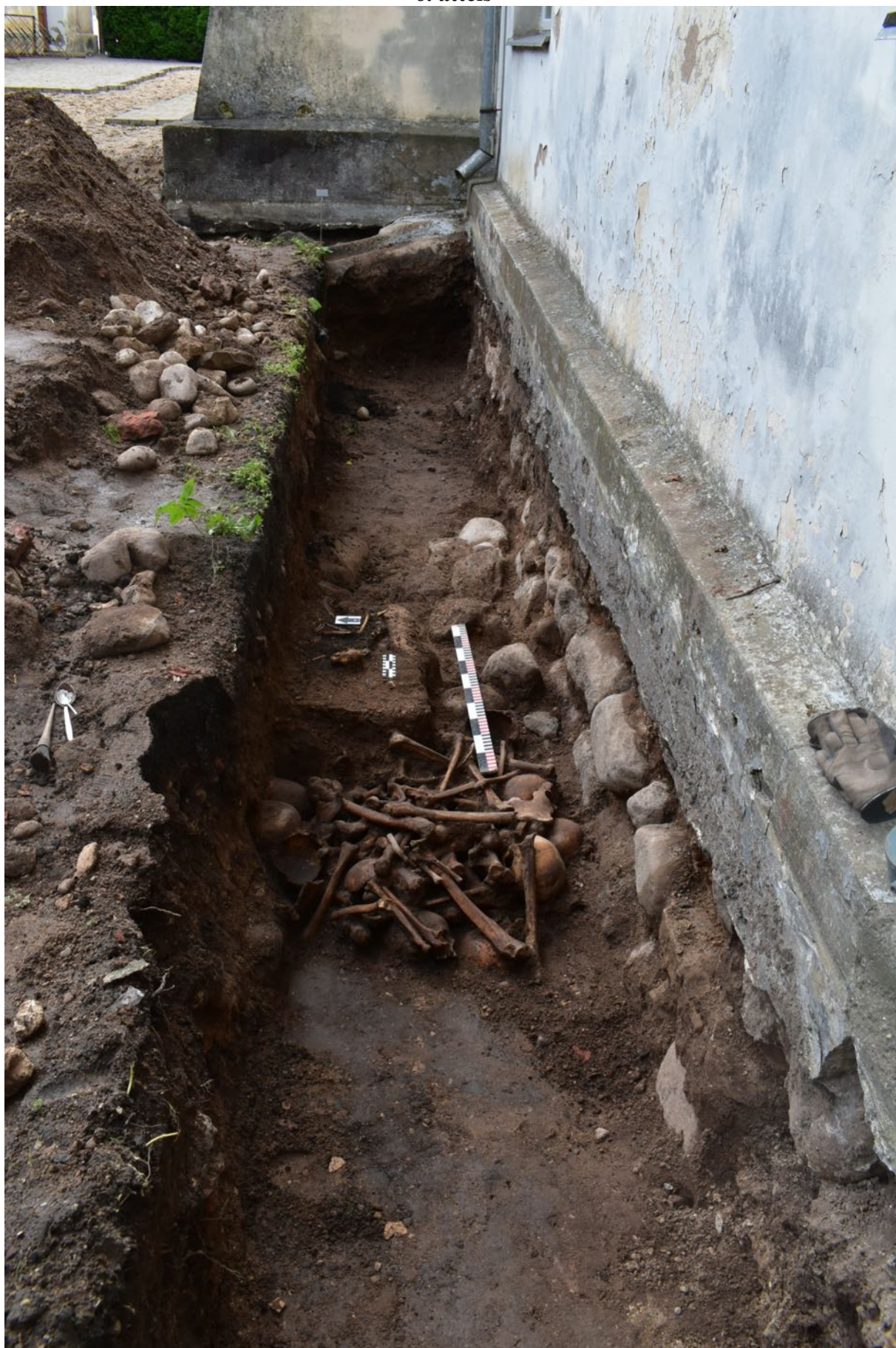
19. tranšeja. Kaķa apbedījums un 1. kaulu kambaris. Skats no rietumiem.