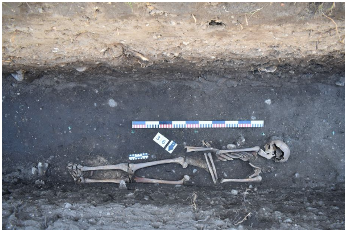
20. tranšeja. 37. apbedījums.