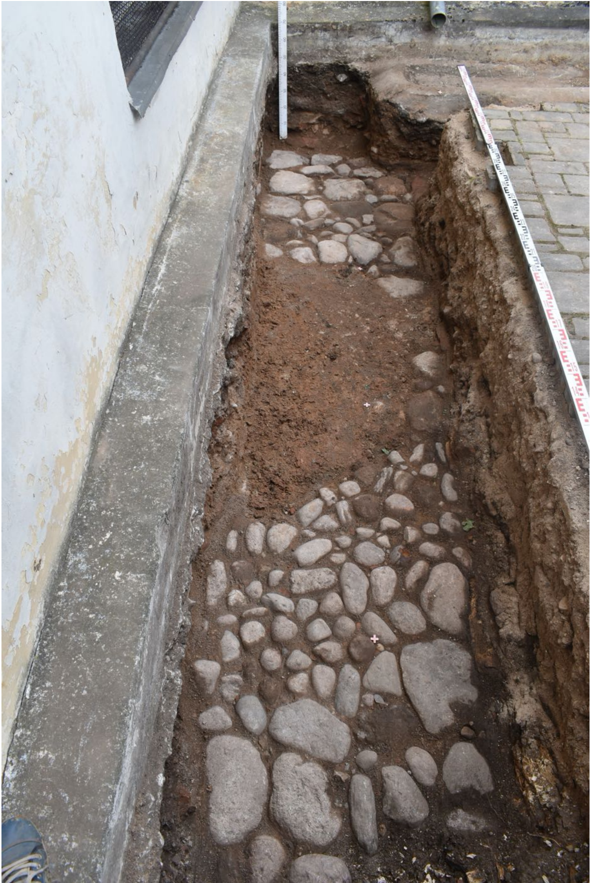
17. tranšēja. Bruģēta apmale.