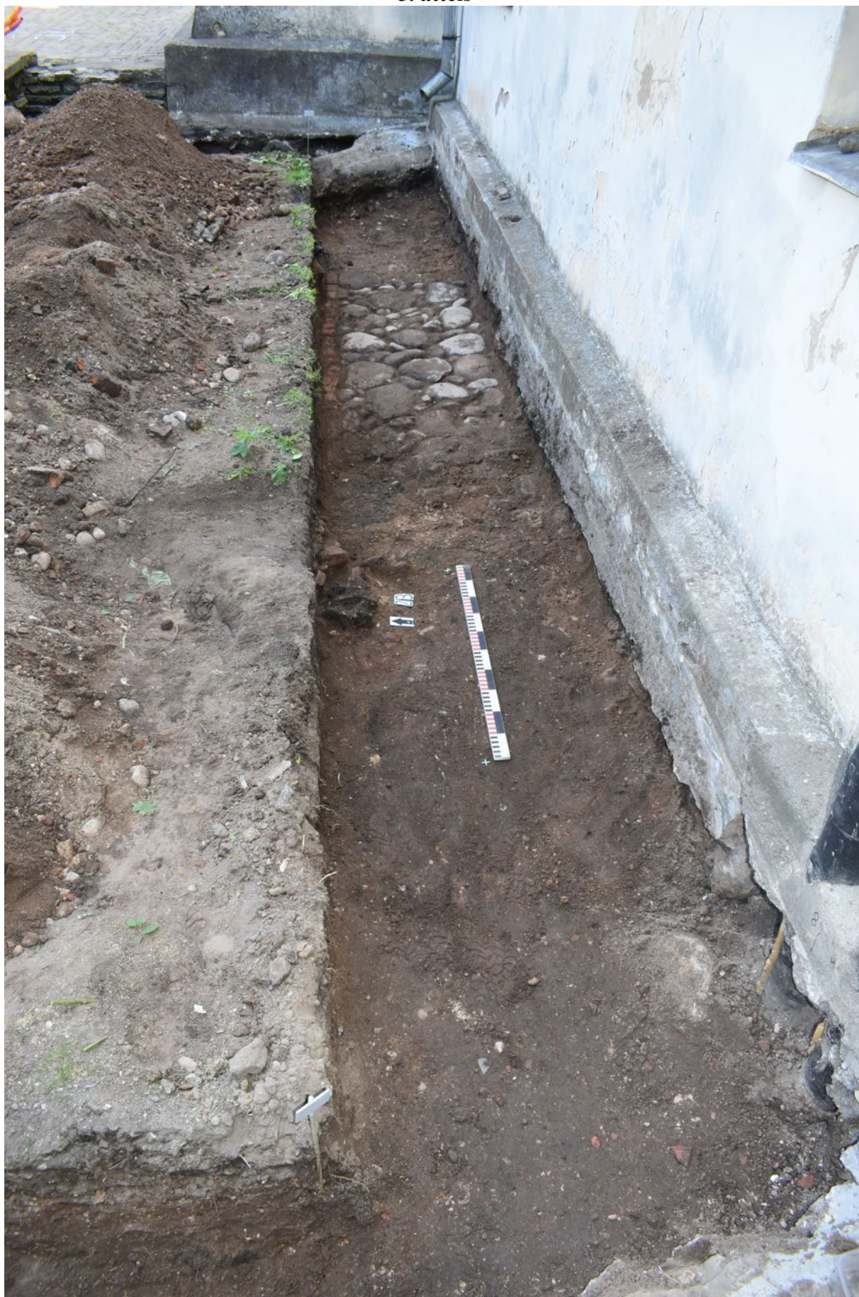
19. tranšeja. 23. apbedījums un bruģētas apmales fragments. Skats no rietumiem.