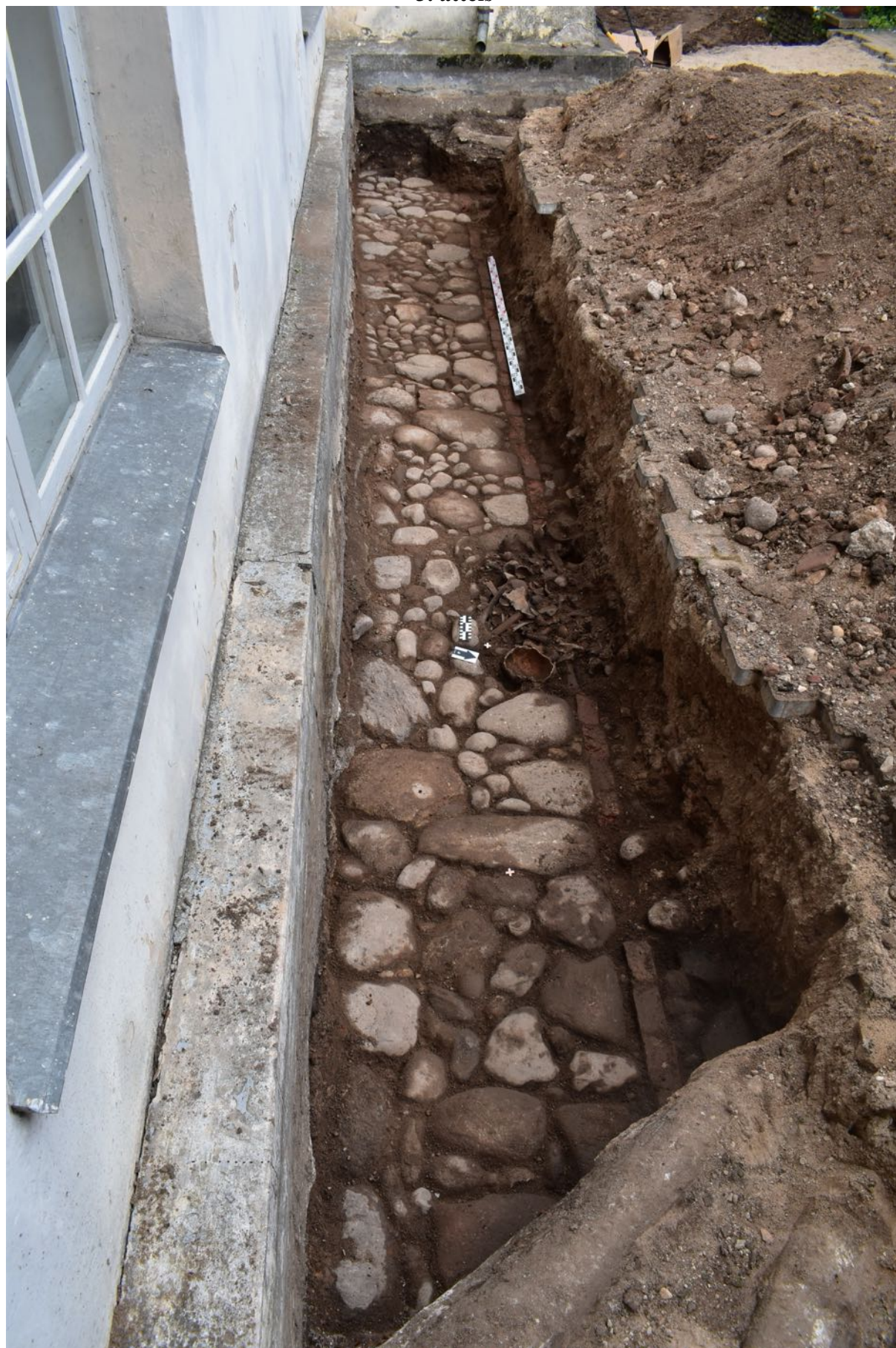
18. tranšeja. Bruģēta apmale un 4. kaulu kambaris.