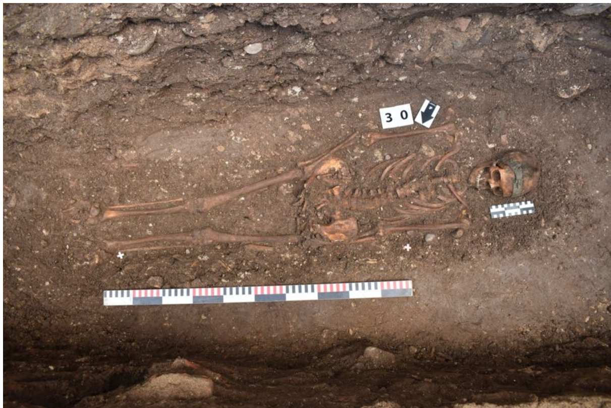
18. tranšeja. 31. apbedījums.