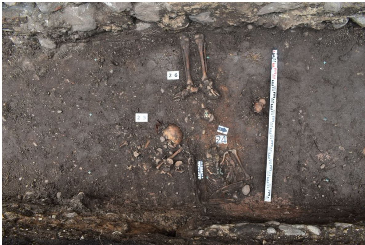
1. laukums. 24., 25. un 26. apbedījums.