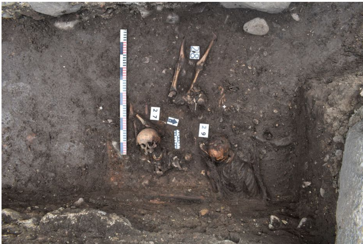
1. laukums. 27., 28. un 29. apbedījums.