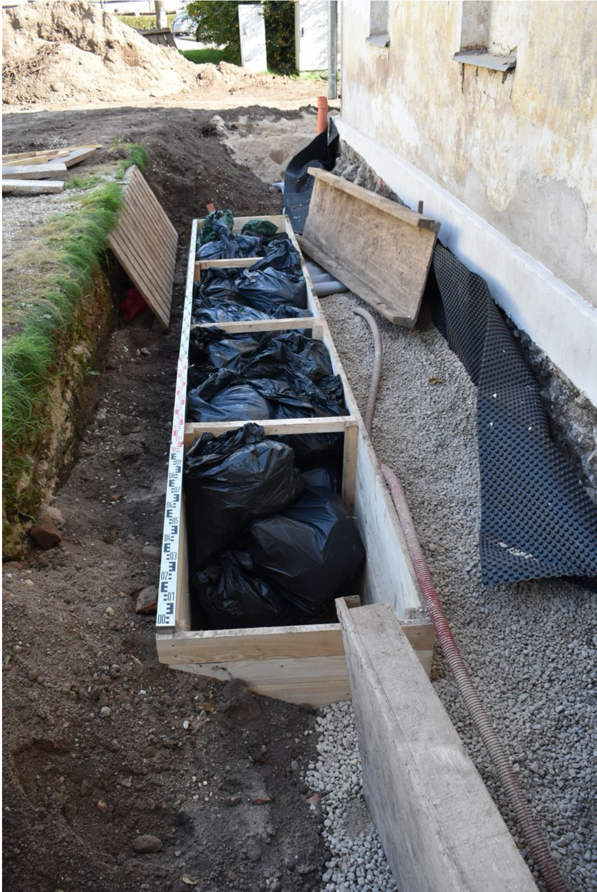
2. laukums, pēc daļējas aizbēršanas. Pārapbedītie postītu apbedījumu skeletu kauli, kas atrasti pētījumos 2019. un 2020. gadā.