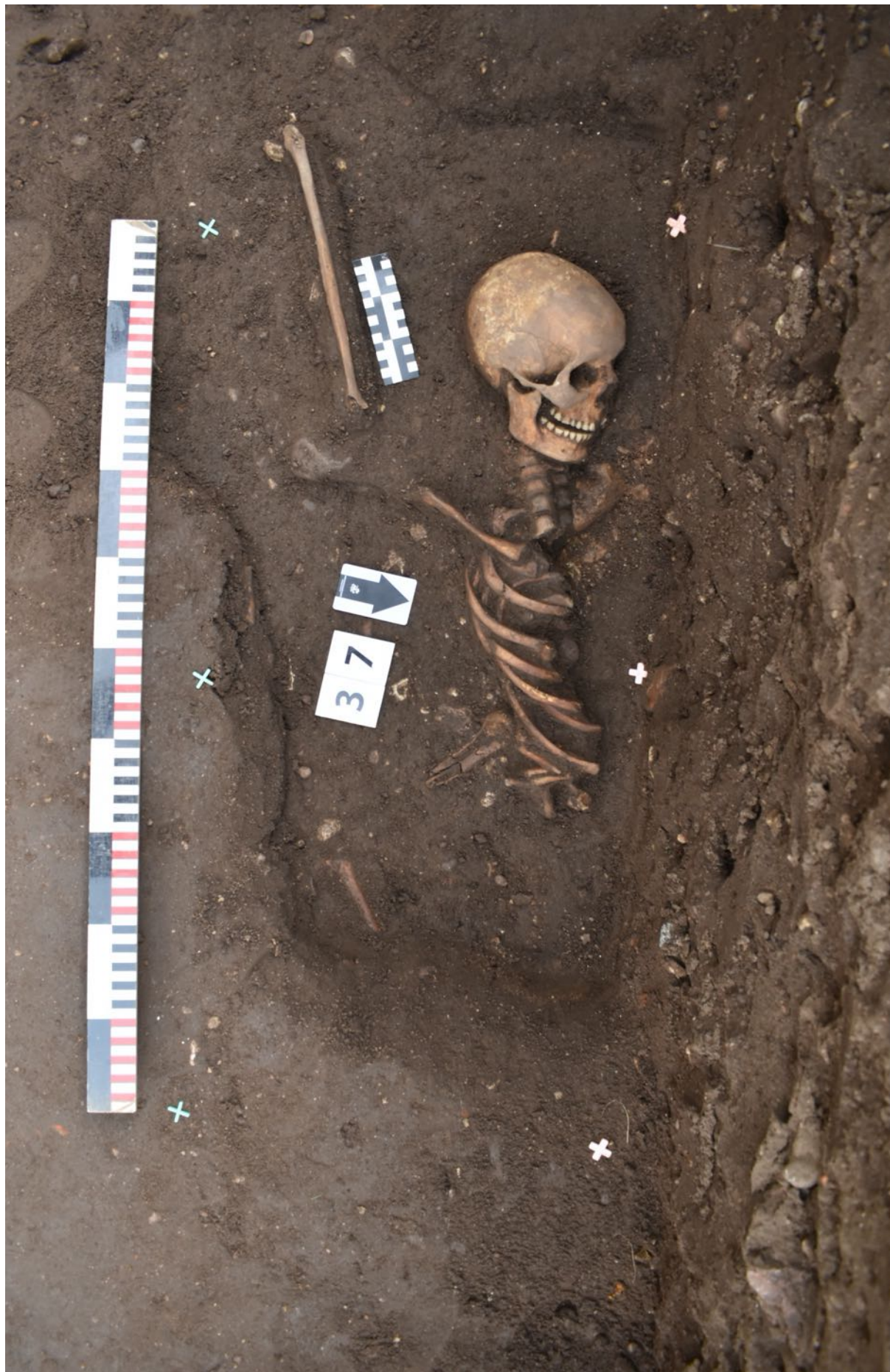
2. laukums. 38. apbedījums.